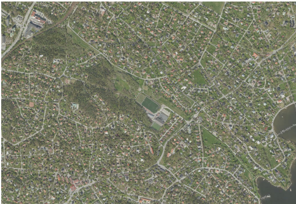
Figur 1: Vy över Grängsgårdens utbredning

Majoriteten av detaljplanerna inom Grängsgärdet anger att områdena ska användas som park, plantering, lek och idrottsplats med undantagsfall från fyra mindre områden i två av detaljplanerna som anger kraftledningar, högspänningsledning och transformatorstation. Kommunen är ägare till samtliga fastigheter inom Grängsgärdet och har redan idag en aktiv skötsel av ytorna med hänsyn till biologisk mångfald. Då kommunen är ägare till samtliga fastigheter inom Grängsgärdet och majoriteten av detaljplanerna redan skyddar områdets grönstruktur skulle en ny detaljplan inte ge någon större skillnad i förbättrat skydd jämfört med de redan befintliga detaljplanerna.